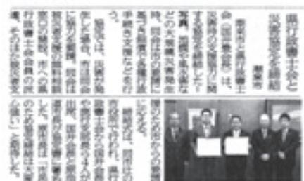
平成27年11月29日（日）茨城新聞

北茨城市（H24年7月）、水戸市（H26年5月）、行方市（H26年7月） 日立市（H26年8月）、東海村（H26年8月）、常陸太田市（H26年10月） 那珂市（H26年10月）、城里町（H27年4月）、つくば市（H27年7月）