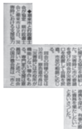
平成27年11月13日（金）毎日新聞