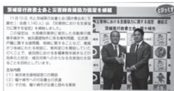
龍ヶ崎市報「りゅうけい」12月前半号