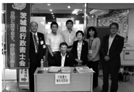
「潮来市立中央公民館」にて