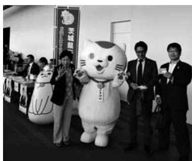
「かみすフェスタ2019」にて