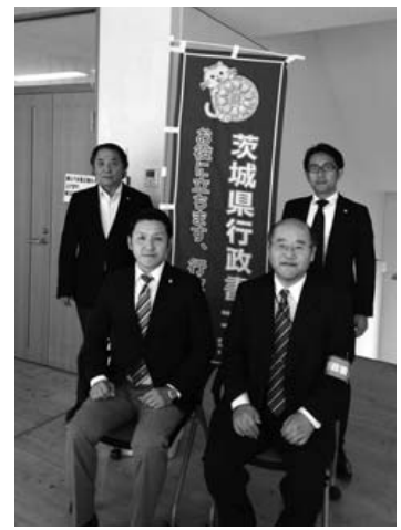
行方市天王崎観光交流センター 「コテラス」にて