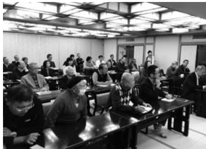
熱心に耳を傾ける参加者