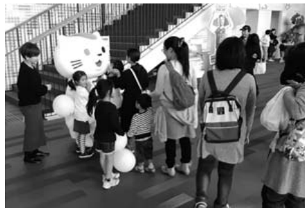
「かみすフェスタ2019」にて