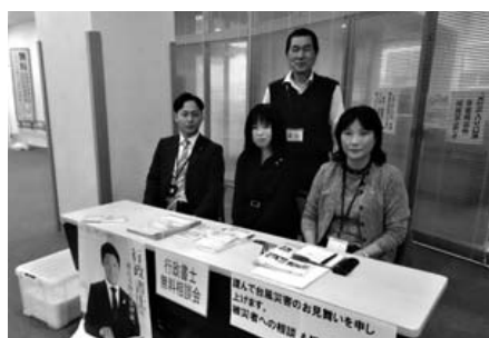
「鹿嶋市立大野ふれあいセンター」にて