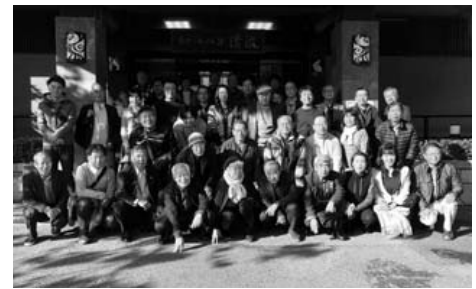
ホテル清流の玄関前にて