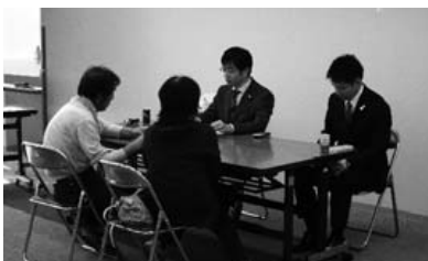
古河市無料相談会