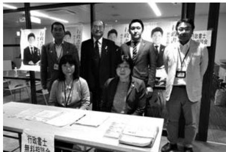
行方市「ファーマーズヴィレッジ」にて