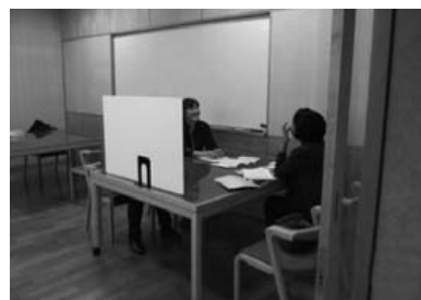
筑西市無料相談会