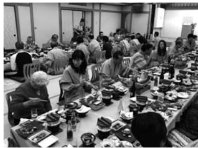
海の幸に舌鼓が鳴る