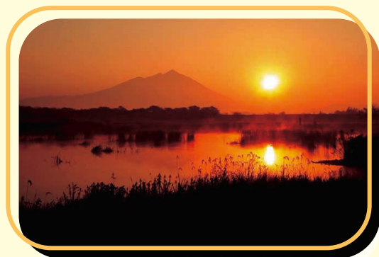
筑西市 母子島遊水池