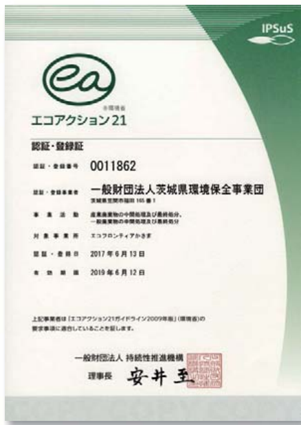
“エコアクション21” 認証・登録証