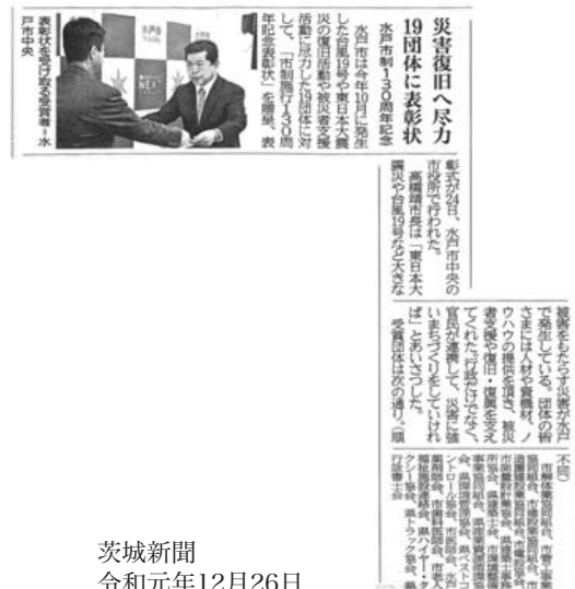
茨城新聞 令和元年12月26日