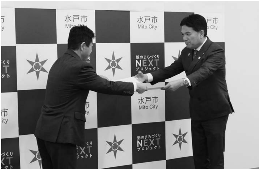
表彰状授与式の様子

令和元年12月24日（火）、水戸市市制施行130周年記念式典に國井会長が出席し、茨城県行政書士会が災害復旧への尽力により表彰されました。